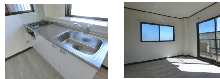
マンションスターダスト 号室配置図